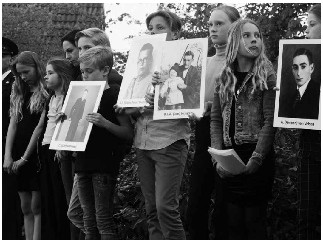
Dodenherdenking 2023 Ugchelen