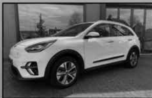
Kia e-Niro 64kWh 06-2021, 44.376km € 36.950,-