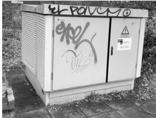
Zó zag het er voordien uit

Op 19 mei werd opnieuw een stroomkast in Ugchelen verfraaid. De kast staat in de Goudvink aan het begin van de Ugchelsegrensweg. Daarvoor was hij vuil en besmeurd met zieloze graffiti. Kom kijken en oordeel zelf of de kast erop is vooruitgegaan!