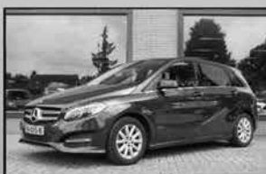
Mercedes-Benz B180 02-2017, 60.415km Cruise control, parkeersensoren € 21.950,-