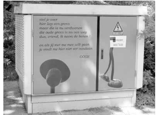
Zó ziet het er nu uit

In dit ontwerp heb ik ervoor gekozen om Goos een stem te geven. Dat prachtige beeld staat vlak achter de stroomkast, in de bossjes van de Goudvink. Een beetje verscholen, nu het blad weer aan de bomen zit. Wie het paadje, links van de stroomkast, inslaat komt er langs. De ontwerper van dat beeld gaf het de naam Goos. Het is afgeleid van Gozewijn, dat betekent allemansvriend.