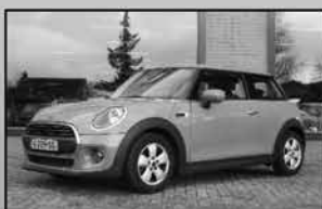
Mini One 1.5 First 11-2019, 26.446km Navi, cruise control, armsteun € 19.199,-