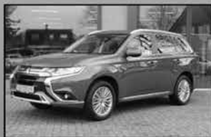
Mitsubishi Outlander PHEV 08-2019, 35.890km Apple CarPlay, trekhaak, als nieuw € 29.950,- Open dak, adaptive cruise