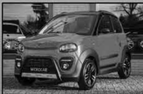
Microcar M.GO6 X Leverbaar met airconditioning en stuurbevestiging Geen autorijbewijs nodig