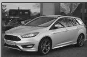
Ford Focus 1.0 ST-line 01-2018, 82.574km Navigatie, 125PK, trekhaak € 17.200,-

Uw partner in mobiliteit Keuze uit ruim 60 occasions!