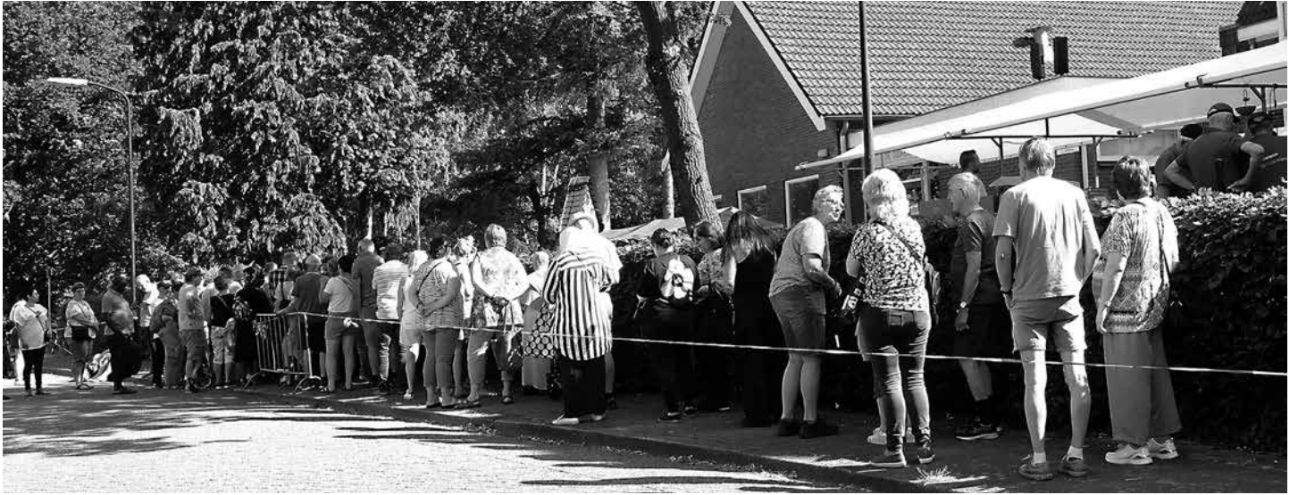
waar mensen met het kleinste