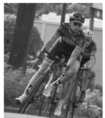
Adelaarrenners duiken de Bazemolenweg in, in een eerdere editie van de Ronde van Ugchelen.

Het "Ugchelens belang", een locatie die het motto qua veelzijdigheid eer aan doet gezien de vele verschillende activiteiten die er plaatsvinden, zal de uitvalsbasis vormen voor zowel de