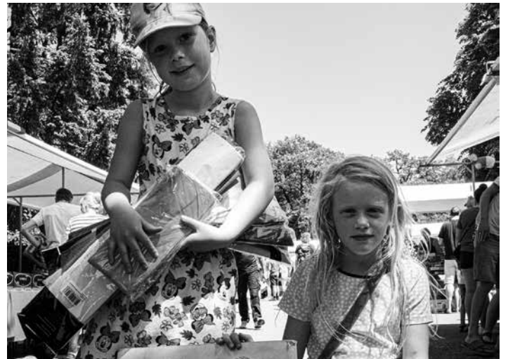
in hun nopjes kunnen zijn