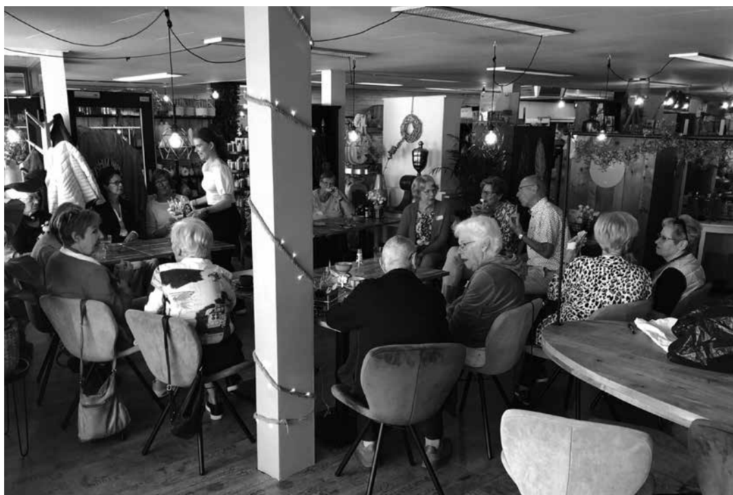
Gezellige drukte in Het Koffiehuus.

Docenten staan klaar om ingezet te worden. Bellen kan ook met Karin Gasseling op het telefoonnummer 055-5295520 of op 06-36003286.